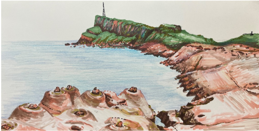
圖 3 自備照片或是素描、手繪簡圖等(請務必註明出處，包含繪製者與繪製時間和地點)