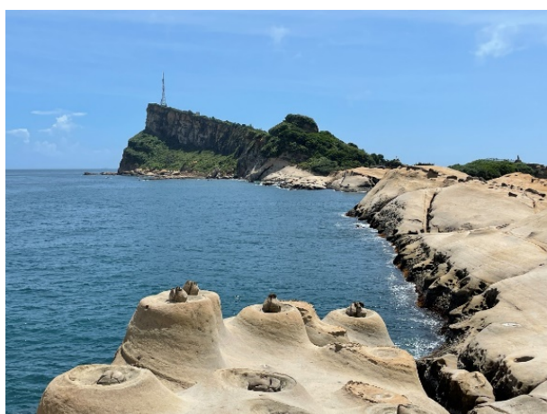
圖 1 台灣地景保育網任選一張地景的照片或自行拍攝或選用照片(請務必註明出處)