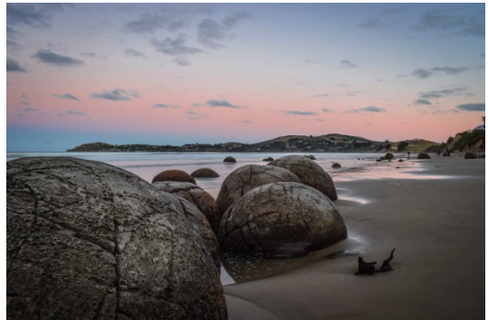
圖12 懷塔基白石聯合國教科文組織世界地質公園