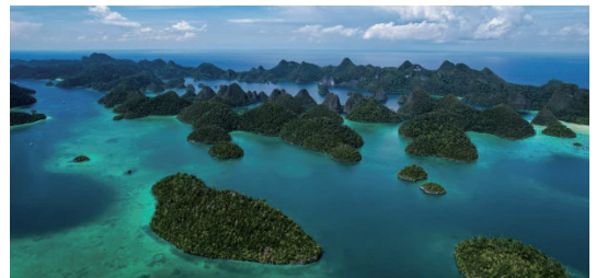
圖7 拉賈安派特聯合國教科文組織世界地質公園