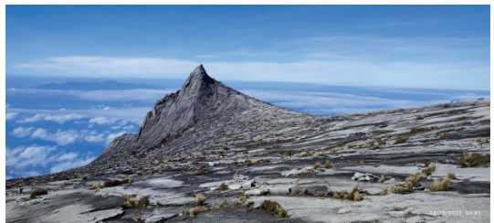
圖11 京那巴魯聯合國教科文組織世界地質公園