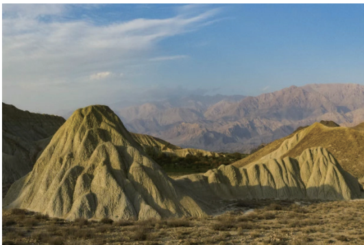
圖8 阿拉斯聯合國教科文組織世界地質公園

桑霍德蘭德（Sunnhordland）地質公園地貌景觀豐富多樣，既有冰川覆蓋的高山，也有沿海灘塗上散落的數千個島嶼。地質景觀以其教科書式的樣本向世人展示著40個冰期內所發生的冰川侵蝕情況。哈當厄爾峽灣（Hardanger fjord）斷層區隔出十億年的地質演化情況。該地質公園展示了火山系統如何造就大陸：在兩個構造板塊交界處，被擠壓的板塊發生皺縮，然後抬升形成山脈，這個過程稱作「造山運動」。地球上最大的造山帶中有2條交匯於此。南邊是與大陸火山弧（15億年前）有關的岩石，北邊則是來自大洋地殼和島弧系統（5億-4.5億年前）的基岩。