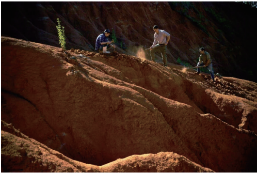
圖2 誇塔科洛尼亞聯合國教科文組織世界地質公園