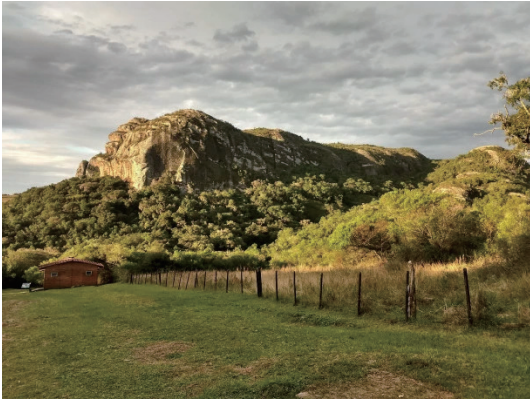
圖1 卡薩帕瓦聯合國教科文組織世界地質公園