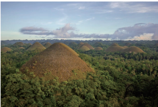
圖14 保和島聯合國教科文組織世界地質公園