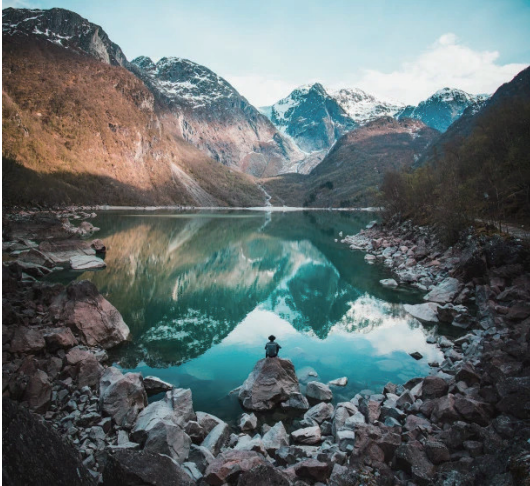
圖13 桑霍德蘭德聯合國教科文組織世界地質公園