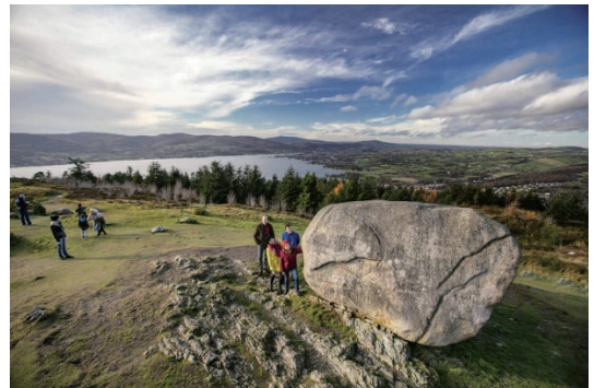
圖18 莫恩-古利安-斯特蘭福德聯合國教科文組織世界地質公園