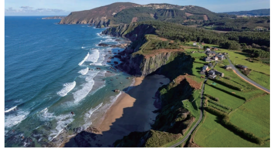
圖16 奧特加爾角聯合國教科文組織世界地質公園