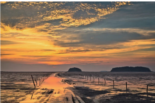
圖15 全北西海岸聯合國教科文組織世界地質公園