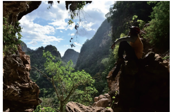
圖5 馬羅斯-龐戈普聯合國教科文組織世界地質公園