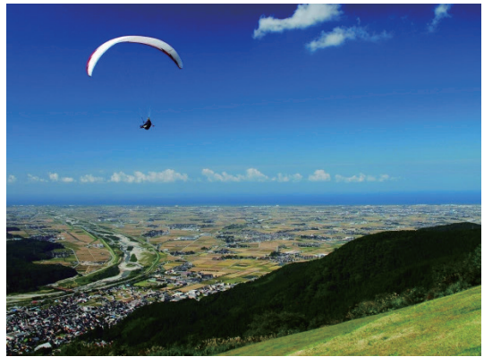
圖10 白山手取川聯合國教科文組織世界地質公園