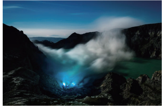
圖4 伊真聯合國教科文組織世界地質公園