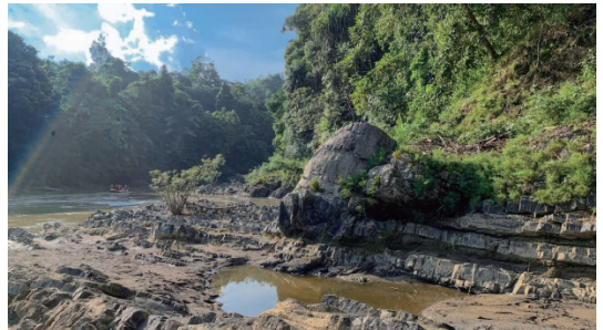
圖6 占碑美蘭音聯合國教科文組織世界地質公園