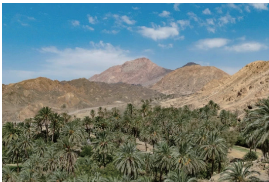
圖9 塔巴斯聯合國教科文組織世界地質公園