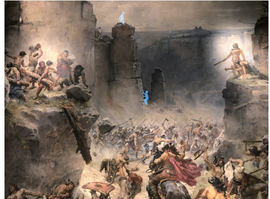
照片7 「波西米亞樂園博物館」以影片展現波希米亞中古世紀在石林中的戰爭（蘇淑娟攝於6/30/2023）