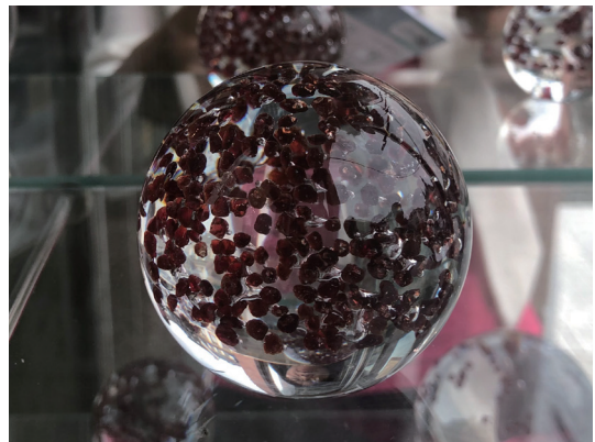
照片8 「波西米亞樂園博物館」以玻璃包裹石榴石的作品，展現此地礦物的複雜性（蘇淑娟攝於6/30/2023）