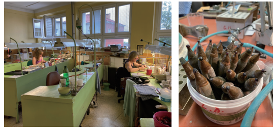
照片5 Turnov寶石工廠的工作環境與工藝器具(顏瑄佑 攝於6/30/2023)