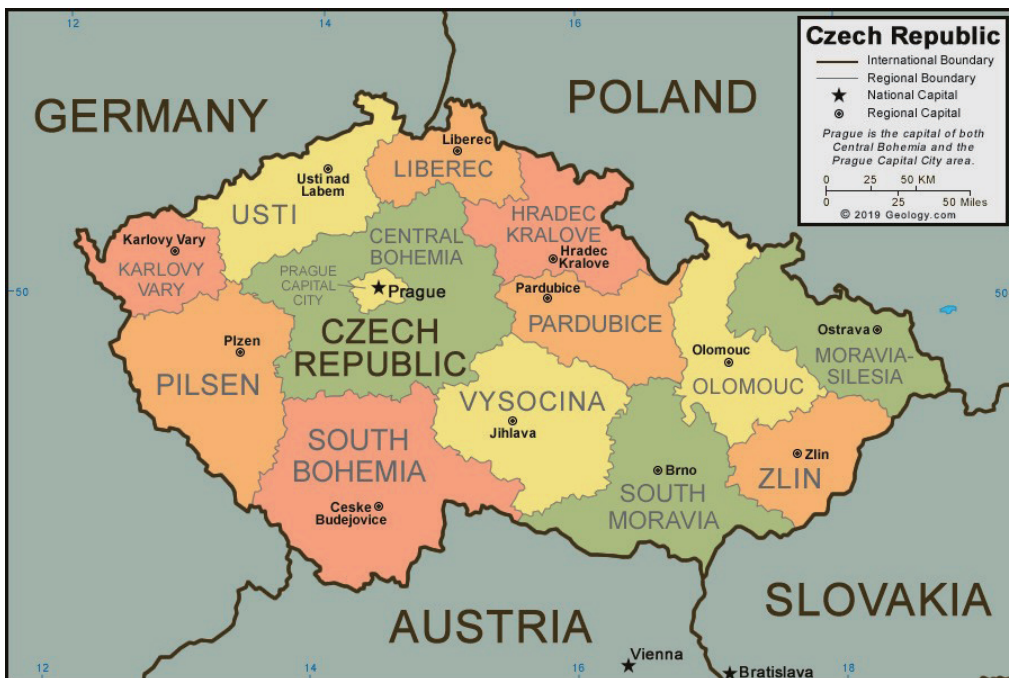
圖2 捷克共和國境內省區地圖（最北偏中央的Liberec為地質公園所在省）

準前各段所述，當代波希米亞樂園全球地質公園已然在地球的自然環境與人文歷史條件上，發展出回應聯合國教科文組織倡議地質公園的期待與主張，該公園不但以地球環境與其知識為本，進行知識與生活關係的傳播，更在當地社會特有組成的條件下，發展環境教育和地景環境旅遊，一切似乎盡合人意、順暢無比。然而卻在2024年冰島舉行的第十七屆歐洲地質公園網絡會議中，該地質公園的代表團卻被口頭告知黃卡 2 的評審審議決定，主要的原因有二，一為該地質公園與圖爾諾夫的波希米樂園博物館似有合作關係，而該博物館卻不恰當地在其商店出售來源不明的寶石等；二為地質公園工作人員數量太少。本文就第一個議題提出簡要論述與意見，並以它作為本文結論議題，一個需要時間討論與辯證的議題。