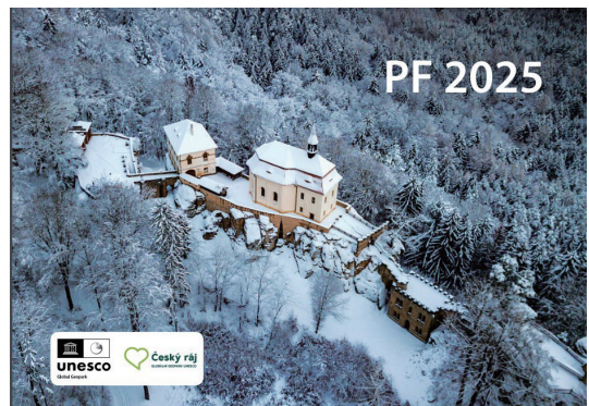
圖3 波希米亞雪景問候2025新年快樂！Seasonal Greeting from Snowy Český ráj! （來源：Blanka Nedvědicá 前波希米亞樂園地質公園主任個人通訊）