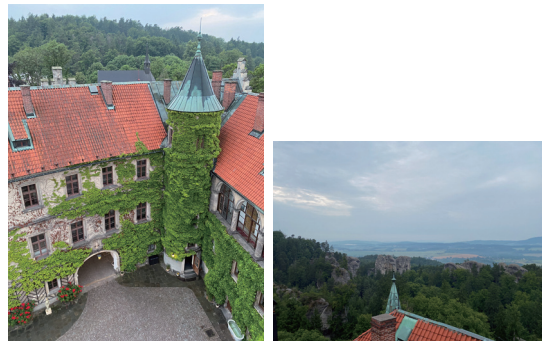
照片6 矗立於平原森林與石林之間的古堡(Zámek Hrubá Skála)(顏瑄佑 攝於7/1/2023)