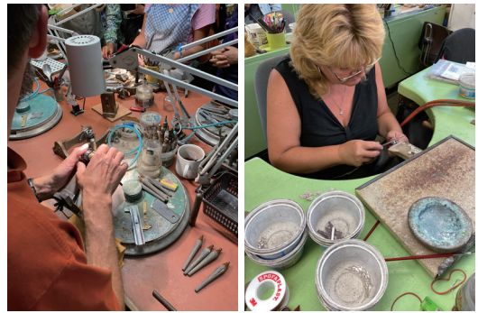
照片4 波希米亞地質公園內Turnov的寶石工藝廠一隅

波希米亞地區位於當代捷克共和國的中西部，是歐洲具重要歷史意義之地，其地理位置、文化影響力和政治角色，均體現在帝國的歷史地理之中。以波希米亞王國而言，它是神聖羅馬帝國的重要王國，不但獨具自治權和影響力，其國王查理四世(1346-1378)更發揮關鍵作用力，促使捷克首都布拉格成為神聖羅馬帝國的首都，對今日捷克有關鍵的文化和政治地位。