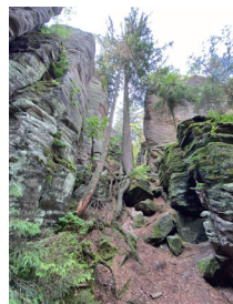
照片2 波希米亞樂園全球地質公園內砂岩石林之間的步道(顏瑄佑 攝於7/1/2023)